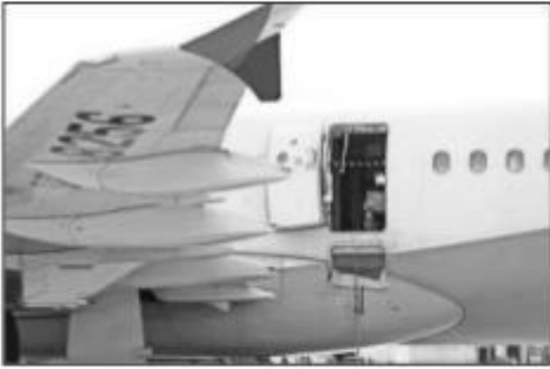
सियोल, 26 मई (एपी)।

एअरलाइन ने एक बयान में कहा कि 26 मई 2023 को बोईंग777 विमान द्वारा संचालित